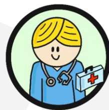
VIPP OPEN Huisartsen