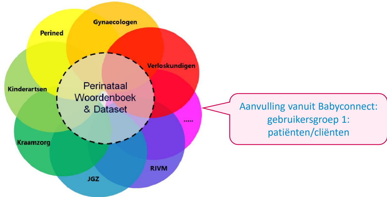
Figuur 1 Samenhang dataset met de datasets van sectoren