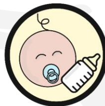
VIPP Babyconnect Geboortezorg