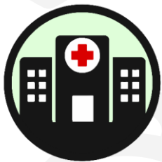
VIPP1 Algemene ziekenhuizen