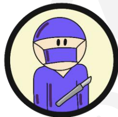
VIPP2 Zelfstandige klinieken