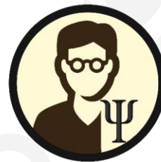
VIPP4 GGZ zelfstandigen