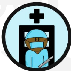
VIPP5 Ziekenhuizen, UMC's, klinieken