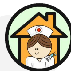
VIPP InZicht Langdurige zorg inclusief uitwisseling ziekenhuizen