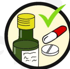
VIPP farmacie Apothekers